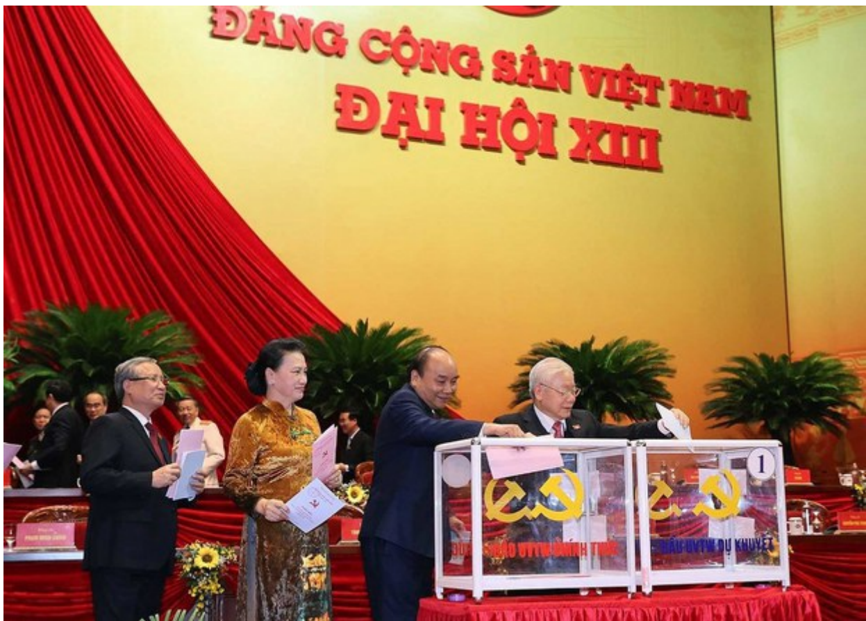
Ảnh minh họa: Đại hội đại biểu toàn quốc lần thứ 13 ngày 30 tháng 1 năm 2021.