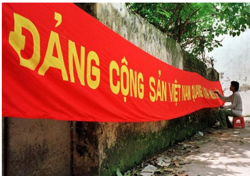
Một người đàn ông đang sơn tẩm biển cổ động cho Đảng Cộng sản Việt Nam ở Hà Nội (hình minh họa).

Những cái đó, chúng ta phải nhanh chóng giải quyết, xóa bỏ hết tất cả và tiến tới một nền kinh tế quốc dân, một nền kinh tế hiện đại và vì vậy Việt Nam phải xây dựng những cơ sở để làm những việc đó, mà trước hết là xây dựng tinh thần, xây dựng ý chí để tiến tới một nền kinh tế hiện đại, hội nhập với nền kinh tế thế giới.”