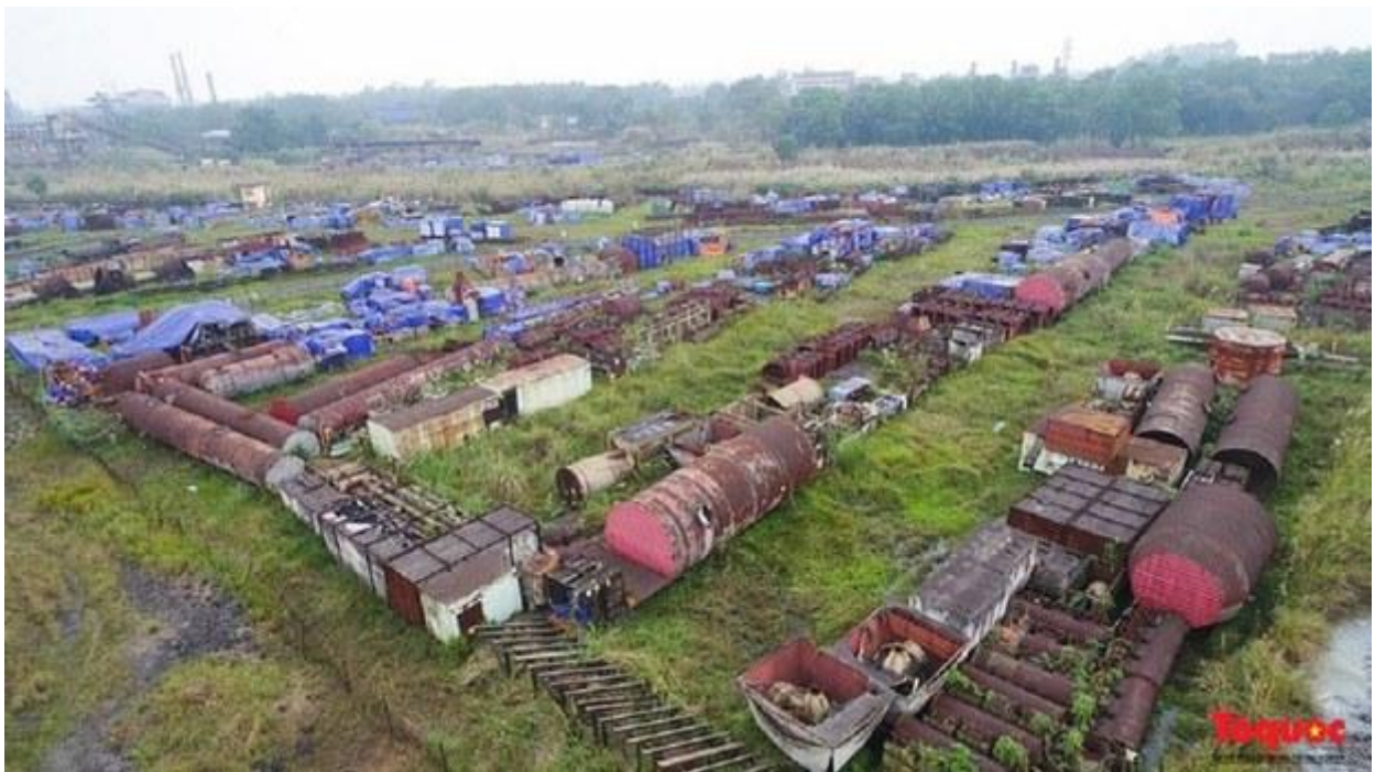
Ảnh minh họa: Dự án mở rộng sản xuất giai đoạn 2 ở Công ty Gang thép Thái Nguyên còn lại đồng sắt hồng.

Mặc dù thành tích đạt được qua một số chỉ tiêu của điều hành kinh tế vĩ mô mà Việt Nam tự đánh giá là đáp ứng, đặc biệt sau ba năm chống chọi với đại dịch Covid-19, có ý kiến từ giới nghiên cứu chính sách quản lý kinh tế và quản trị quốc gia cho rằng mô hình kinh tế của Việt Nam đã ‘bộc lộ áp lực lớn’ là tiền đề để có những thay đổi.